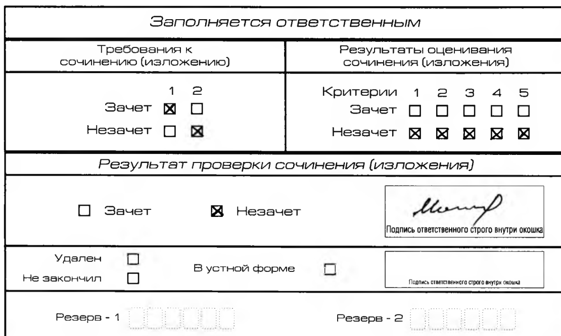
Рис. 7. Область для оценки работы

Выставляется «незачет» за невыполнение требования № 2. В клетки по всем критериям оценивания выставляется «незачет». В поле «Результат проверки сочинения (изложения)» ставится «незачет» (см. рис. 7).