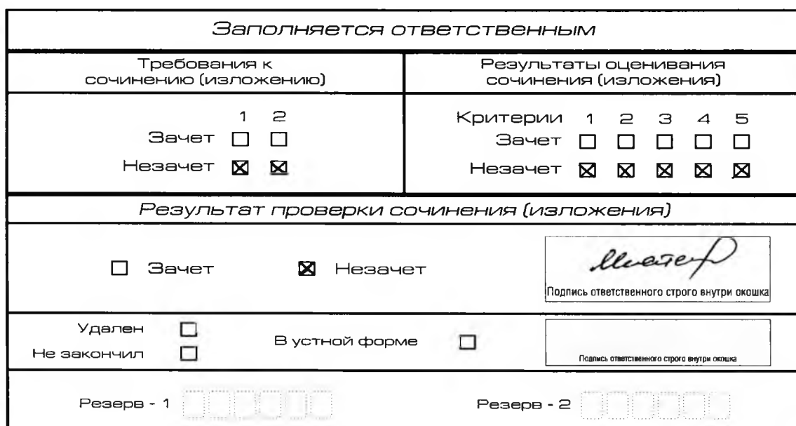
Рис. 6. Область для оценки работы

В клетки по всем требованиям (№ 1 и № 2) и критериям оценивания выставляется «незачет». В поле «Результат проверки сочинения (изложения)» ставится «незачет» (см. рис. 6).