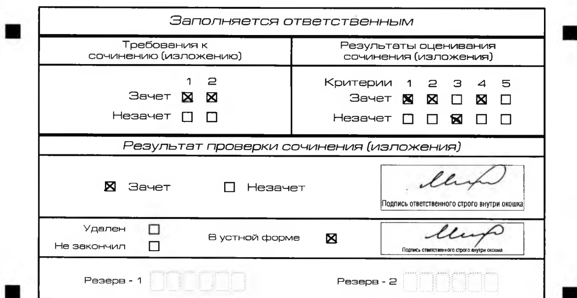
Рис. 9. Область для оценки работы сочинения (изложения) в устной форме

После окончания заполнения бланка регистрации ответственное лицо ставит свою подпись в специально отведенном для этого поле.