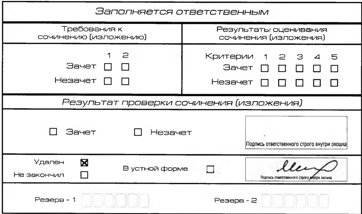
Рис. 11. Заполнение полей нижней части бланка регистрации (удаление с экзамена)